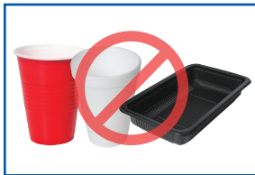
Nhựa số 6 và nhựa đen