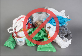
Túi nhựa và màng phim

Các vật dụng sau gây ra các vấn đề trong quá trình tái chế vì chúng bị vướng vào thiết bị, có thể gây hại cho công nhân và không có thị trường thuận lợi để chuyển đổi chúng thành vật liệu mới. Loại bỏ những vật dụng này ra khỏi quá trình tái chế của quý vị. Tìm hiểu thêm tại hennepin.us/recycling