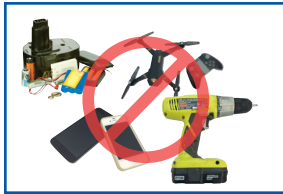
Thiết bị điện tử và pin/ ắc-quy