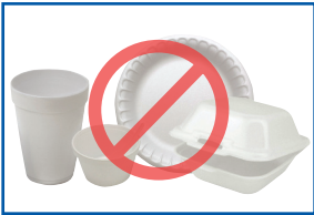
Xốp nhựa (Styrofoam™)