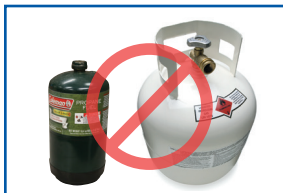
Bình khí nén (propan, heli, CO2)