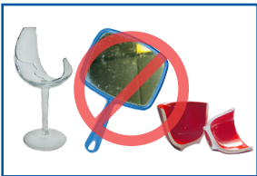
Đĩa thủy tinh, kính cửa sổ và đồ gốm sứ