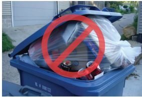
Tái chế đóng túi