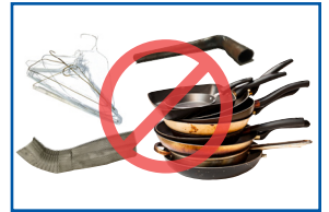
Vật dụng kim loại ngẫu nhiên