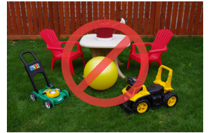
Các vật dụng nhựa lớn và đồ chơi