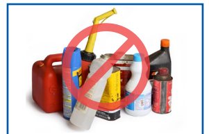
Các thùng chứa sản phẩm nguy hiểm