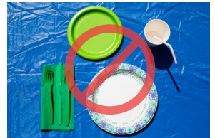
Đĩa giấy, ly giấy, khăn ăn, ống hút và đồ gia dụng